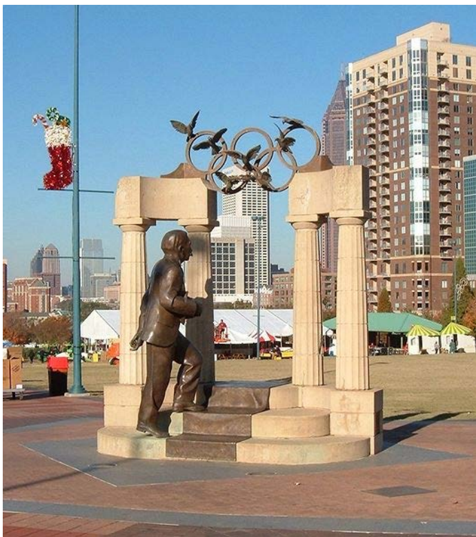
Slika 1. Spomenik Pjeru de Kubertenu